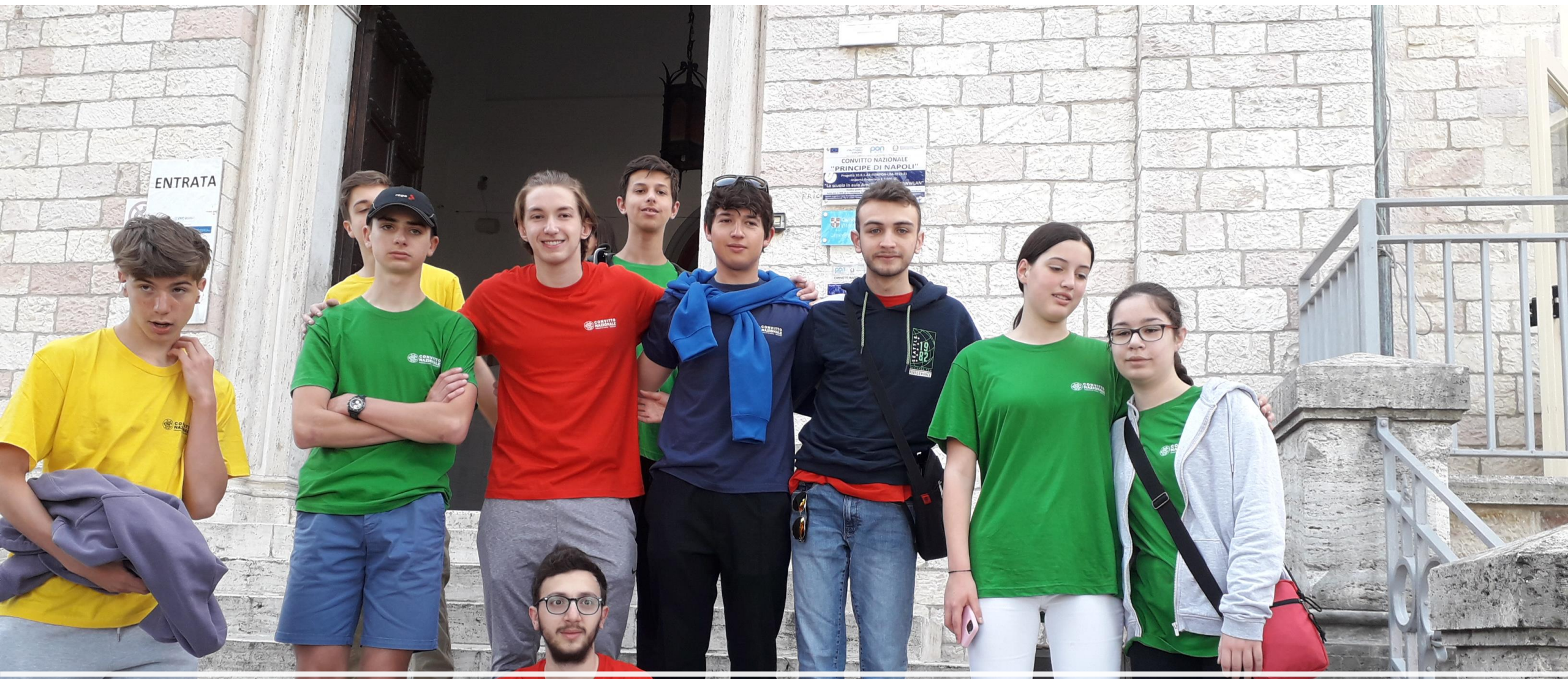
ASSISI:LA SQUADRA LOMBARDA